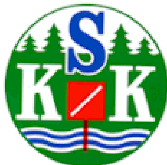
Stockholms Skogskarlarars klubb